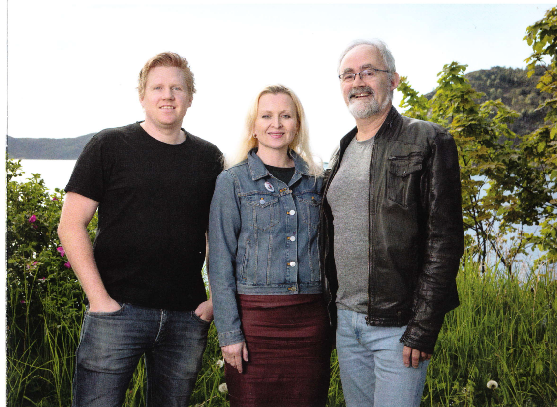
FOTO STUDIO GLIMT, OPPSETT ORIGINAL HAUGE, TRYKK HUSABØ PRENTEVERK